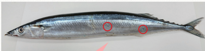
【さんまのウロコの画像】

さんまのウロコは非常にはがれやすく、漁獲する際にほとんど摩擦ではがれてしまいます。しかし、表面に残っていたり、はがれたウロコがさんまの口から入り、おなかの中から発見されたりすることもあります。